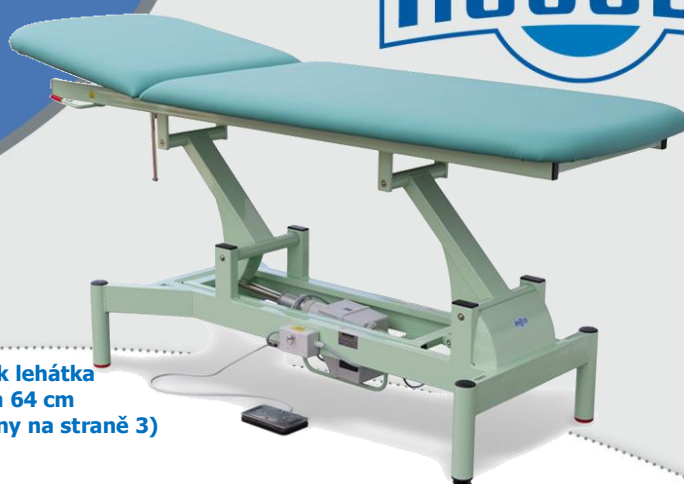
Ilustrační obrázek lehátka s podhlavníkem 64 cm (další varianty zobrazeny na straně 3)