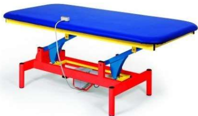
Lehátko GE1 v provedení „kanárek“