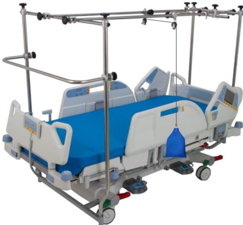
ilustrační obrázek použití zátěžového sáčku s extenčním systémem

Jde o zdravotnický prostředek určený především do zdravotnických zařízení.