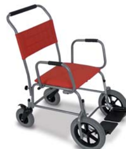
K96-05 křeslo pojízdné