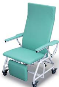
KBL-02 (mechanické) křeslo pro kardiaky