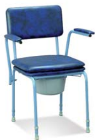
LUX toaletní křeslo

- toaletní křesla, křesla pro kardiaky, přepravní křesla a jiné (úplný sortiment naleznete na www.rousek.eu )