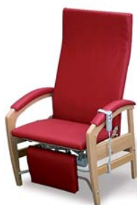
KBLW-12 (elektrické) křeslo pro kardiaky