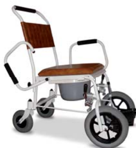
KK96 toaletní křeslo pojízdné