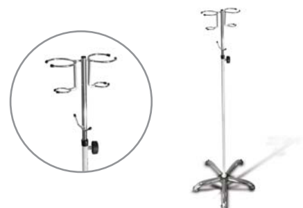
Infuzní stojan pojízdný