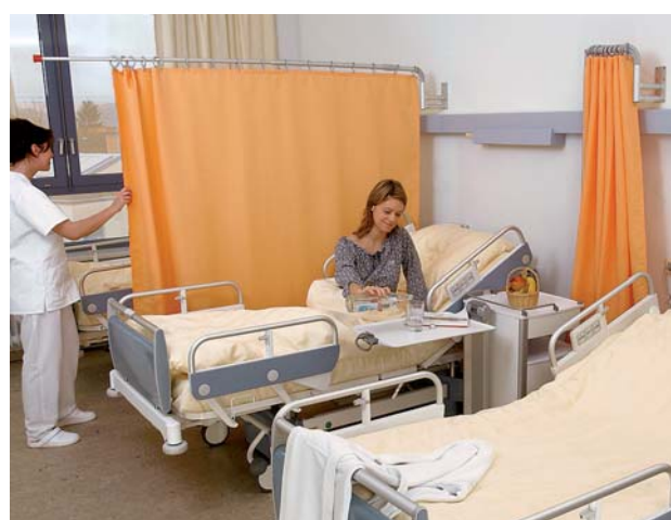
Ilustrační foto teleskopické zástěny: držák WH/LA, rameno RTI 2,2 (výkyvné/sklopné). Závěs: látka Trevira CS